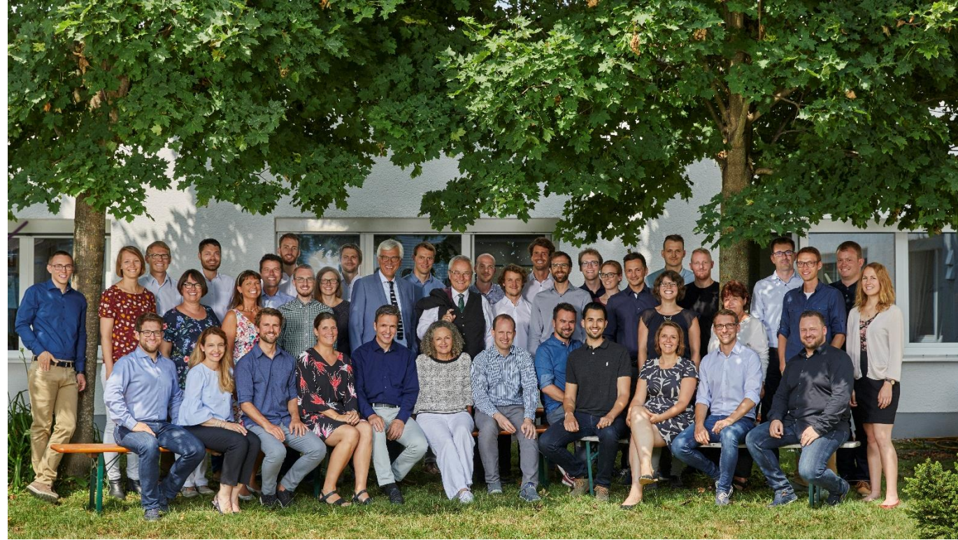
Forschungsgesellschaft für Energiewirtschaft mbH Am Blütenanger 71 80995 München Tel.: +49(0)89 15 81 21 – 0 Email: info@ffe.de Internet: www.ffegmbh.de Twitter: @FfE_Muenchen