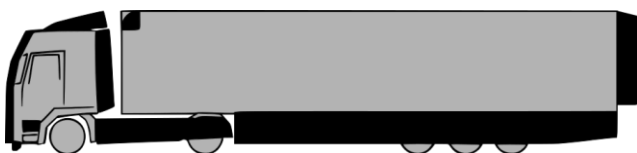
Abbildung 2: Elemente zur Verringerung des Luftwiderstandes (IREES)

Abhängig von Größe und Einsatz eines Lkw macht der Luftwiderstand einen großen Anteil des Kraftstoffverbrauchs aus (siehe Abbildung 1). Zur Verringerung des Luftwiderstandes eines Lkw sollte zunächst sichergestellt werden, dass der Dachspoiler auf der Zugmaschine die richtige Höhe für den Anhänger und die mitgeführte Zuladung hat. Außerdem sollte nach Möglichkeit auf Lkw-Zubehör wie Schutzbügel, Drucklufthörner und Zusatzscheinwerfer verzichtet werden. An der Zugmaschine kann das Anbringen von Luftleitblechen, einer Frontverlängerung, Türsturzverlängerungen, Kotflügelverbreiterungen und Seitenverkleidungen den Kraftstoffverbrauch deutlich senken und entstehende Turbulenzen vermindern. Am Anhänger beziehungsweise Auflieger können zusätzlich eine Seiten- und Unterbodenverkleidung sowie ein Heck-einzug installiert werden. Allein durch diese drei Maßnahmen kann der Widerstandsbeiwert um bis zu 18 Prozent gesenkt werden (UBA 2015).